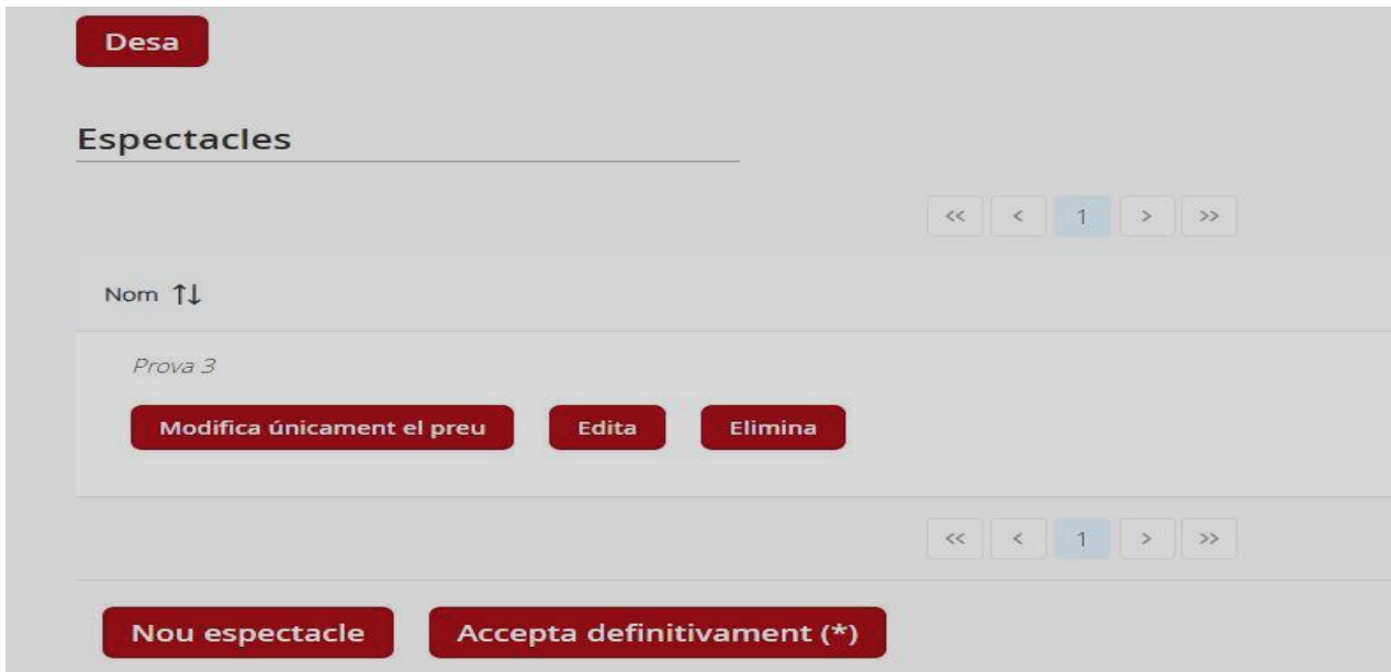
IL·LUSTRACIÓ 7. Taula d'espectacles.