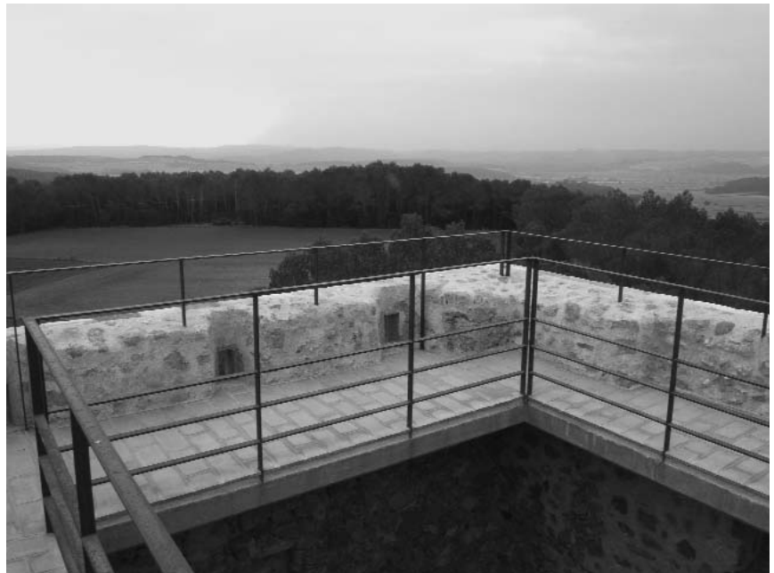
Vista presa des de la part superior de la torre, des d'on es dominava visualment aquest sector de la plana de l'Empordà.

Estructuralment, per les seves característiques hom pot incloure la torre de Pontós dins de la línia general de telegrafia òptica, l'anomenada