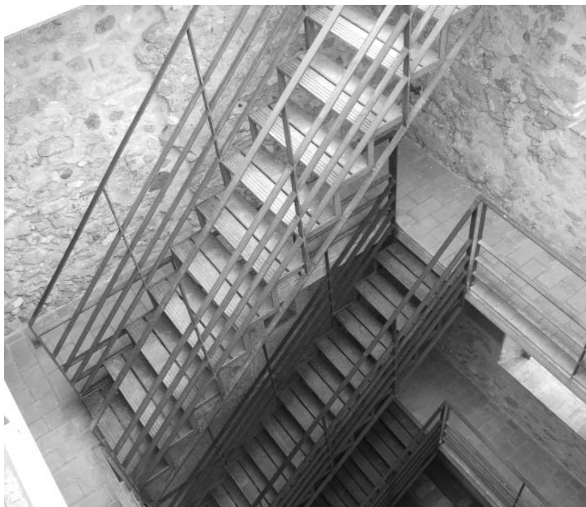
Interior de la torre un cop restaurada, amb els tres nivells de pas recuperats, que ahora serveixen per lligar el conjunt i donar-li solidesa.

es va arrebossar amb morter de calç, però no el que quedava colgat amb el reblliment, que presentava un perfil poc acurat. Probablement, la nova tarima devia tenir un coronament superior a manera de paviment o enrajolat que feia més fàcil la circulació per sobre, però no se n'ha conservat res. A la planta primera no es modificà el nivell, el qual coincideix amb l'entrada original —una porta accessible mitjançant una escala de fusta, que podia ser ràpidament recollida en cas de perill—. A la planta segona, en canvi, és on es produïren les principals reformes, ja que se n'abaixà substancialment el nivell per poder abaixar també la coberta; es creà així una terrassa un metre més baixa que la cornisa (inicialment es cobria a dalt), i es construïren unes espitlleres de defensa, aprimant parcialment la paret. També és possible