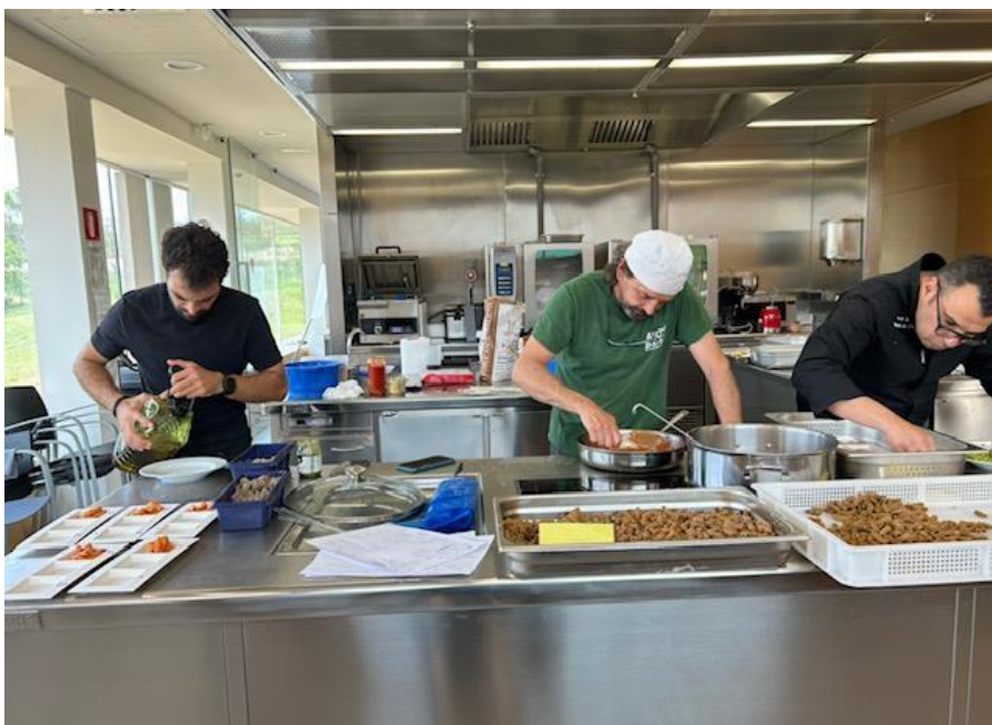
Dinàmica d'innovació. Dia 4 de Design Sprint. Proves de concepte a la cuina industrial del CINGI.