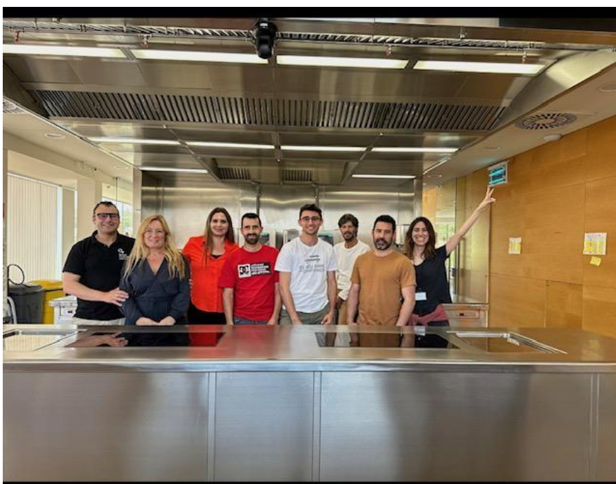
Dinàmica d'innovació. Equip de Design Sprint, format per diferents agents i professionals de la cadena de valor agroalimentària i del canal HORECA.