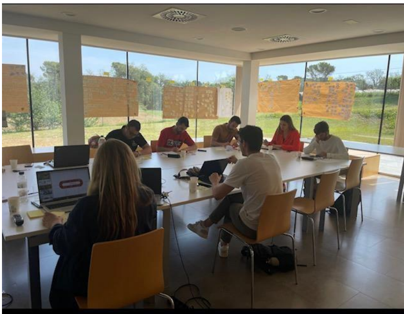
Dinàmica d'innovació. Dia 2 de Design Sprint. Sala multifuncional del CINGI.