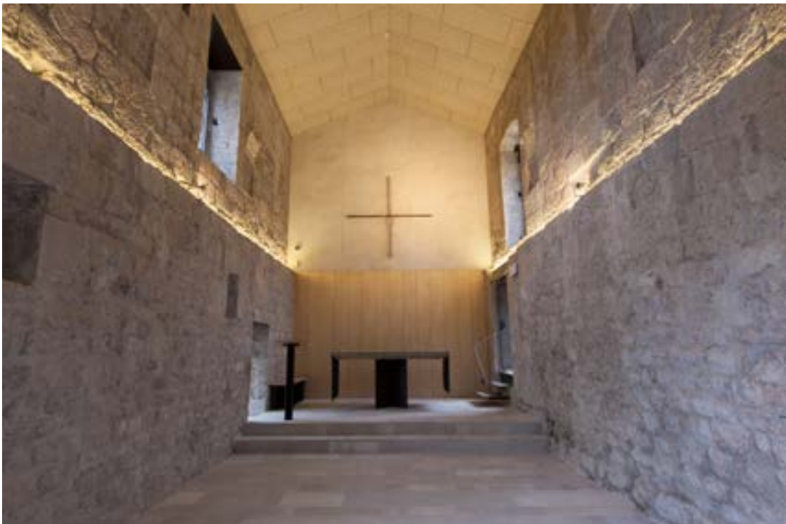
Sala capitular i actual església de Sous un cop finalitzades les obres de restauració.