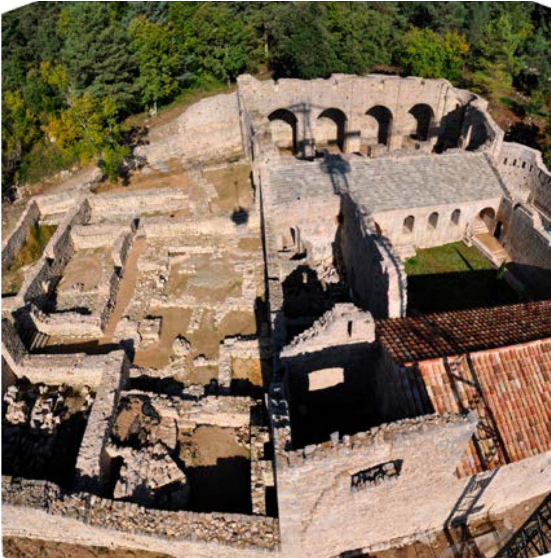
Vista aèria del conjunt monàstic en les fases finals de la seva restauració. Concretament, hi podem observar el claustre, l'església i els edificis annexos ja excavats i en procés de restauració.

També cal esmentar que el monestir fou una mena de camp de proves per al mateix Servei de Monuments, atès que s'hi inicià una pràctica que, posteriorment, ha esdevingut habitual en totes les intervencions que emprèn. Consisteix a desenvolupar, de forma paral·lela a les tasques de neteja i excavació del conjunt, un procés de consolidació i restauració de les restes arquitectòniques que es posen al descobert. Això respon a la constatació que, si quan s'efectua una intervenció arqueològica ràpidament no es fan tasques de consolidació de les restes descobertes, aquestes inicien un procés de degradació imparable que, en el pitjor dels casos, culmina amb la desaparició total. 4 Cal no oblidar que la major part d'obres que es gestionen des del Servei es troben en llocs muntanyencs on