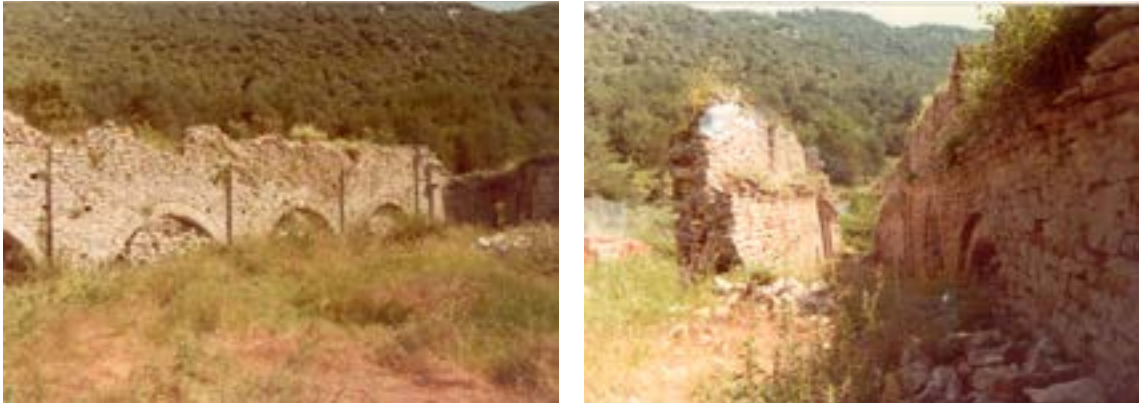
Naus central i lateral nord de l'església romànica de Sosp poc abans d'iniciar-se les intervencions l'any 1985. Estaven totalment cobertes de terra i runa i amb els arcs formers paredats des de l'època moderna.