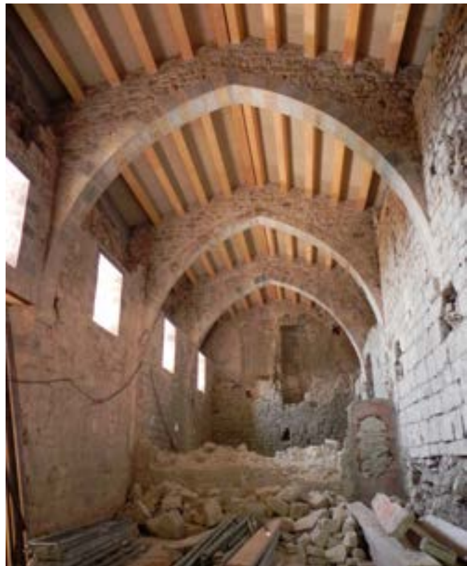
Recuperació de la sala capitular gòtica i dels arcs apuntats que la cobrien, alguns dels quals havien estat paredats a principis del segle XX, en bastir l'església i la rectoria de la parròquia de Sous.