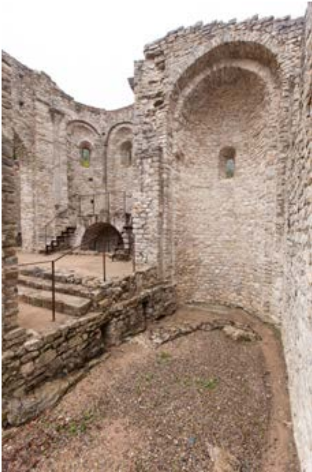
Capçalera de la nau sud de l'església romànica un cop excavada i restaurada. Les intervencions arqueològiques localitzaren en aquest sector les restes de l'absis semicircular (visible a la part inferior esquerra de la imatge) d'una esglésiola preromànica que va ser l'origen del monestir.

el clima, sobretot a l'hivern, pot arribar a ser força cru, la qual cosa pot afectar unes restes extremadament fràgils que s'havien conservat bé pel fet de restar enterrades, però tan aviat com s'han posat al descobert s'inicia un procés de degradació ràpid. El monestir de Sous, situat a la muntanya del Mont, a quasi mil metres d'altitud i amb un temps complicat i sovint canviant, va ser una escola d'aprenentatge perfecta. En concret, aquestes obres consistiren a consolidar mínimament tots els murs del recinte i, si calia, a refer-ne algunes filades de pedra per donar-los més estabilitat, tal com es feu a l'absis i a l'absidiola sud (la nord ja s'havia refet en la fase anterior perquè amenaçava ruïna). També es finalitzà la neteja de runes en la zona del claustre on es consolidaren les banquetes que sostenien els porxos desapareguts.