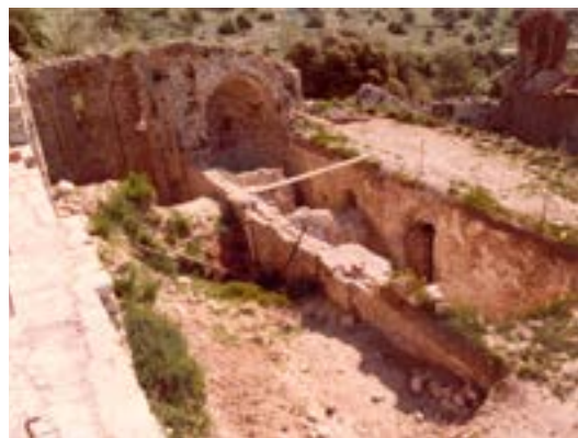
L'església romànica en procés d'excavació. Actuació duta a terme, majoritàriament, per joves que participaven als camps de treball organitzats per la Generalitat de Catalunya.