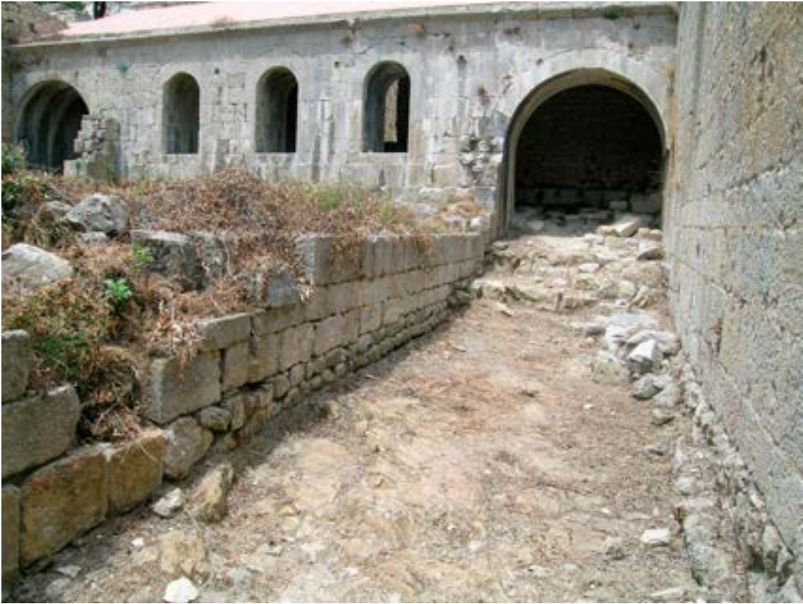
Fotografia de l'ala est del claustre en procés de desenrunament. La imatge permet observar que les ales est i oest del claustre eren graonades, per salvar així el pendent existent.