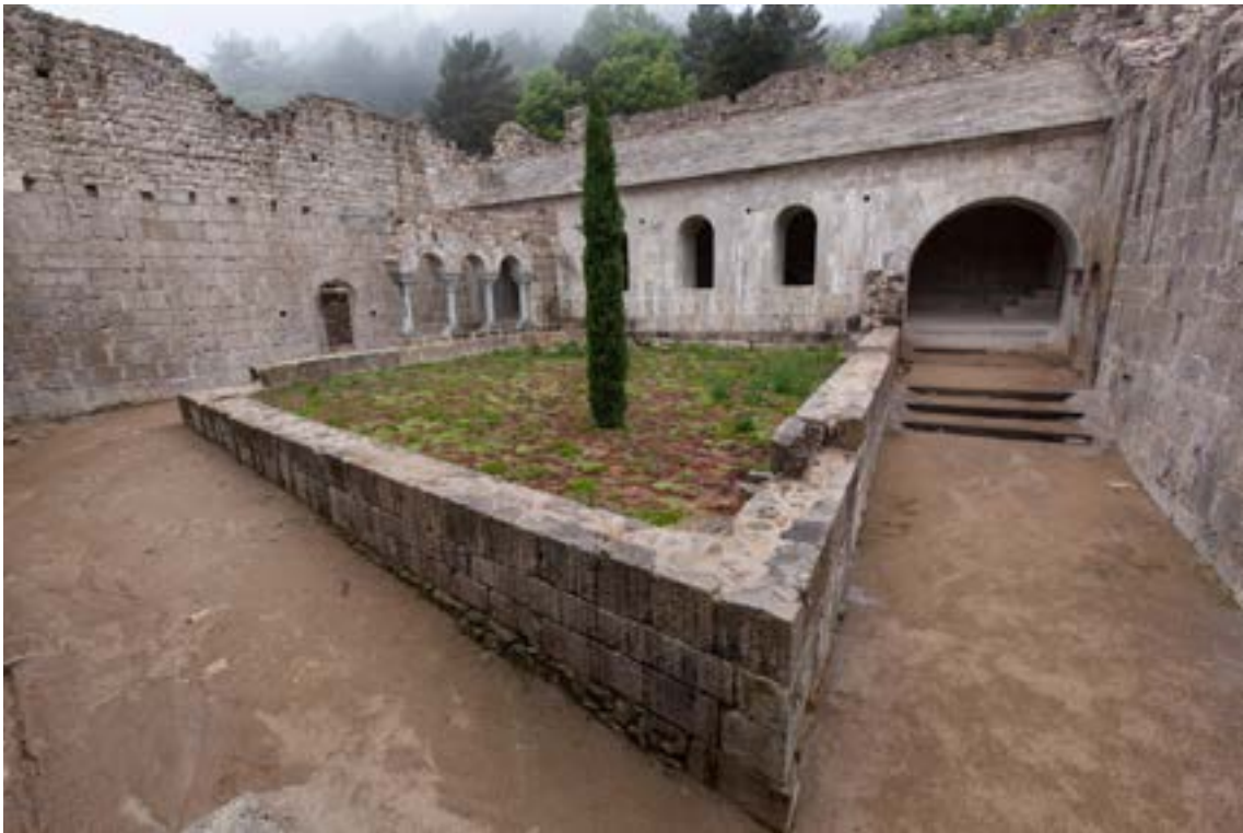
Vistes del claustre del monestir un cop finalitzades les obres de restauració.